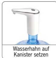
Wasserhahn auf Kanister setzen