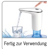
Fertig zur Verwendung